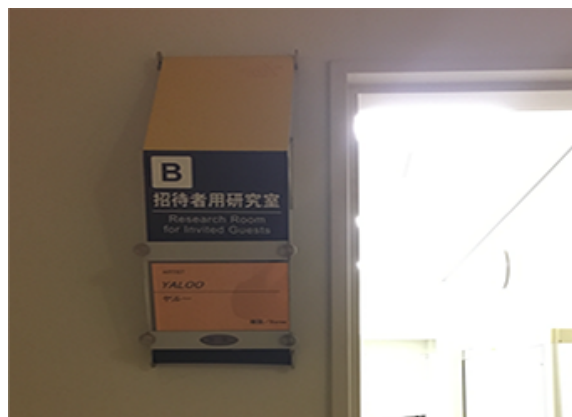
Yaloo Castle Site at Fukuoka