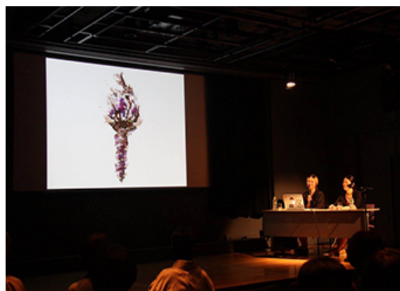
Yaloo Castle Site at Fukuoka