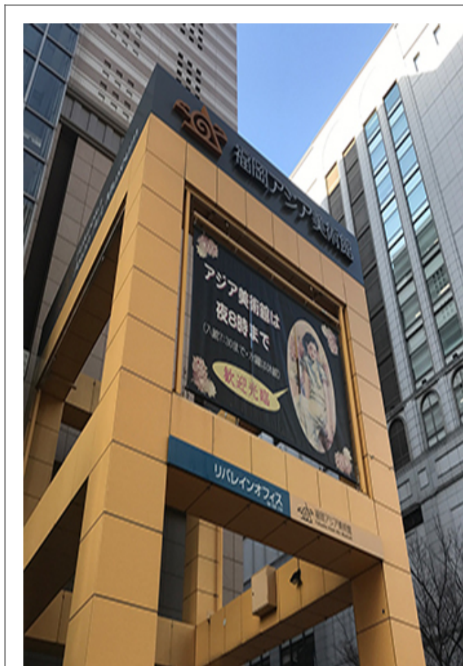
Yaloo Castle Site at Fukuoka

2017年 10月 10日 10時 30分 10時 30分 10時 30分 2018年 10月 10日 10時 30分 10時 30分 10時 30分。このサイトは、Yaloo Castle Site at Fukuokaの紹介ページです。このサイトは、Yaloo Castle Site at Fukuokaの紹介ページです。このサイトは、Yaloo Castle Site at Fukuokaの紹介ページです。