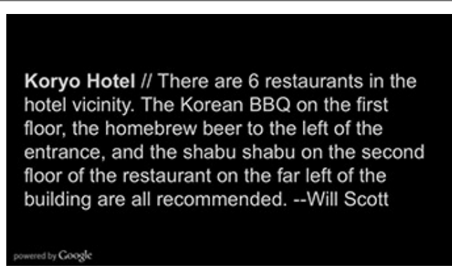
<Google Map>_Koryo Hotel Google 2015