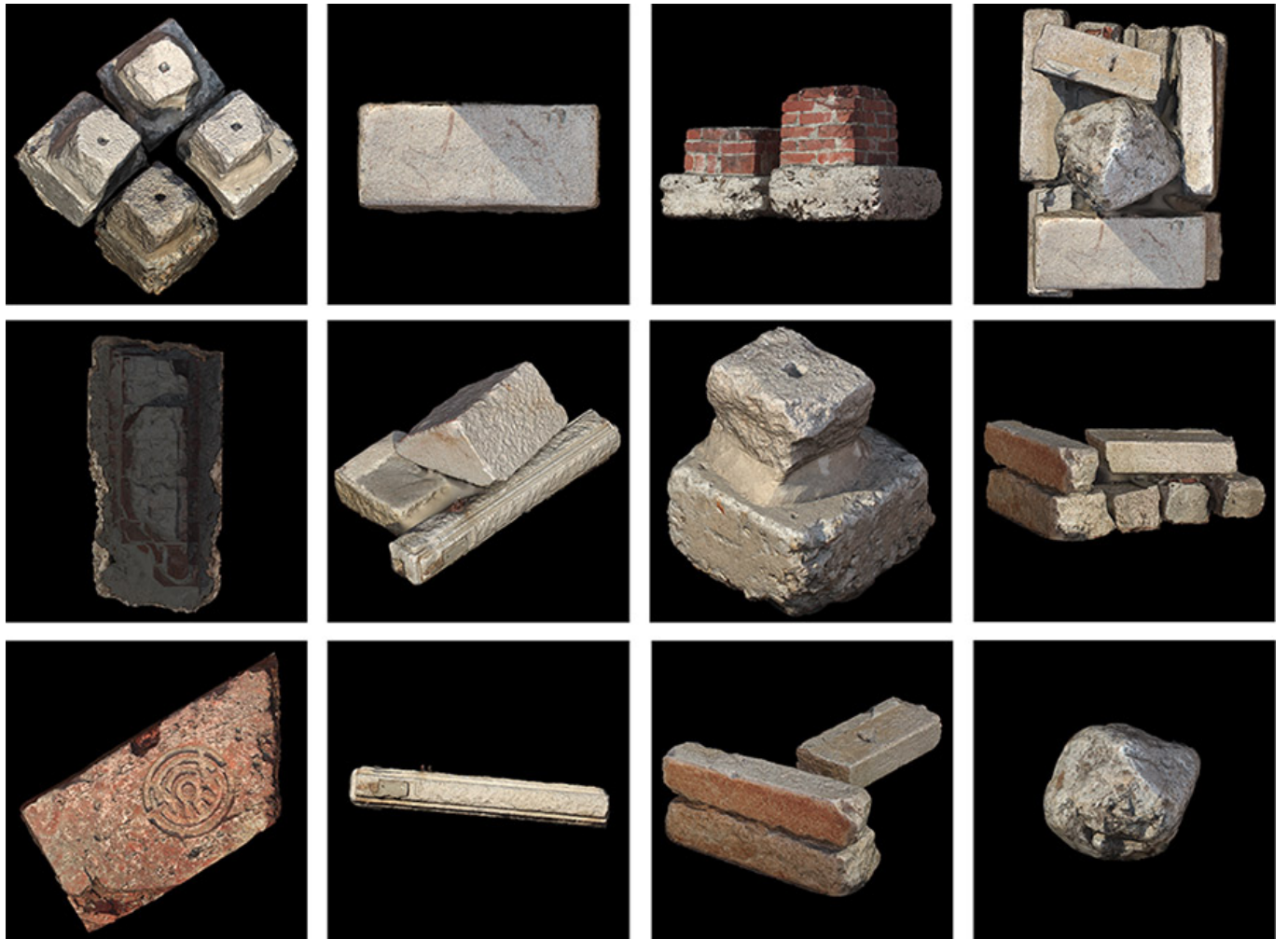
<0000 00>_00000 000 0000000 000 0000_0000, LED, 1CH 00, 000, C-Print_2017

A. 0000 0000 000 00 00 000 000 00 0000, 00 000 00 000000 0000 0000. 00 000 0000 00 0000 000 000 0000 000 000 000 000 000 000 000 00 00 000000 0000. 00 000 00 00 000 00 000 0000 000 000 000 00 0 00, 00 000 000 0 00 0 0 000 000 0000. 000 000 00 00000 0000 0 0000 000 00000 00000 0000 000 00 00000 0000 00 0000. 0 000 000 000000 00 0 000, 000 000 00000 00000 00000 0000.