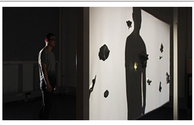
<作品名>_3D印刷, 作者名, LED_2014

この作品は、視覚と聴覚の両方から情報を得ることで、異なる視点から世界を捉えることを目指している。視覚的な要素と聴覚的な要素を組み合わせることで、観客は作品の世界をより深く理解し、体験することができる。