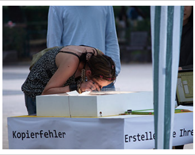
<作品名>_作者(氏名), 展示場所(美術館名)_開催年 年_2009