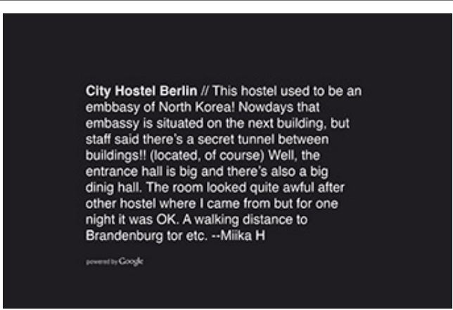
<Google Map>_City Hostel Berlin Google Map 2015