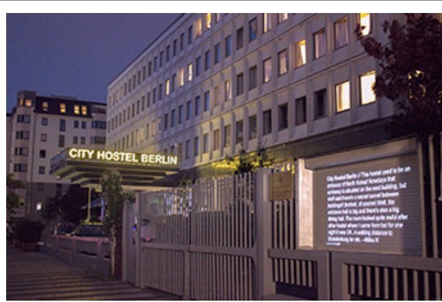
<Google Map>_City Hostel Berlin App 2015