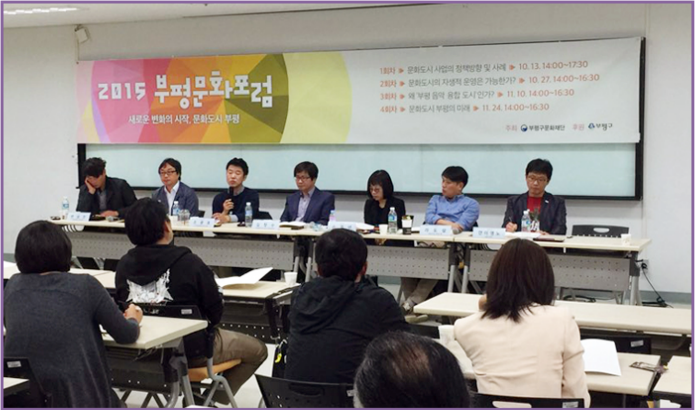
2015 부평문화포럼_새로운 변화의 시작, 문화도시 부평

이 자리, ‘문화도시 사업의 정책방향 및 사례’에 대해 문화도시 사업의 정책방향 및 사례에 대해 논의하는 자리였다. 이 자리, ‘문화도시의 자생적 운영은 가능한가?’에 대해 문화도시의 자생적 운영은 가능한가에 대해 논의하는 자리였다. 이 자리, ‘왜 부평 음악 융합 도시인가?’에 대해 왜 부평 음악 융합 도시인가에 대해 논의하는 자리였다. 이 자리, ‘문화도시 부평의 미래’에 대해 문화도시 부평의 미래에 대해 논의하는 자리였다. 이 자리, ‘문화도시 사업의 정책방향 및 사례’에 대해 문화도시 사업의 정책방향 및 사례에 대해 논의하는 자리였다. 이 자리, ‘문화도시의 자생적 운영은 가능한가?’에 대해 문화도시의 자생적 운영은 가능한가에 대해 논의하는 자리였다. 이 자리, ‘왜 부평 음악 융합 도시인가?’에 대해 왜 부평 음악 융합 도시인가에 대해 논의하는 자리였다. 이 자리, ‘문화도시 부평의 미래’에 대해 문화도시 부평의 미래에 대해 논의하는 자리였다.