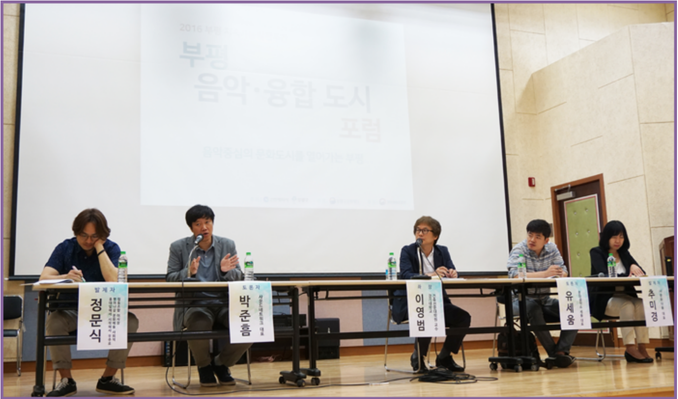
2016 부평 지속가능발전주간 '부평 음악·융합도시 포럼 - 음악중심의 문화도시를 열어가는 부평'

부평은 2015년 문화도시로 선정된 이후, '문화도시'의 의미를 어떻게 풀이할 것인지에 대해 고민하고 있다. '문화도시'란 '문화'와 '도시'가 결합된 형태를 의미하는데, '문화'는 단순히 예술이나 공연만을 지칭하는 것이 아니라, 도시 전체가 하나의 문화공간이 되도록 하는 것을 의미한다. '도시'는 단순히 주거와 상업의 공간이 아니라, 사람들이 모여 살아가는 공동체 공간을 의미한다.