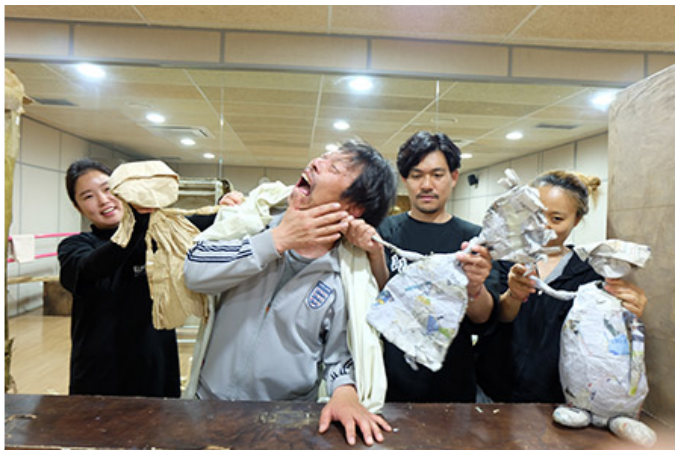
종이 인형으로 극<이야기 하루>를 연습 중인 팀원들

이러한 과정은 팀원들이 서로의 아이디어를 존중하고, 다양한 관점에서 문제를 바라볼 수 있도록 돕는다. 또한, 팀원들이 자신의 아이디어를 적극적으로 표현할 수 있도록 장려한다. 이 과정은 팀원들이 서로의 아이디어를 존중하고, 다양한 관점에서 문제를 바라볼 수 있도록 돕는다. 또한, 팀원들이 자신의 아이디어를 적극적으로 표현할 수 있도록 장려한다.