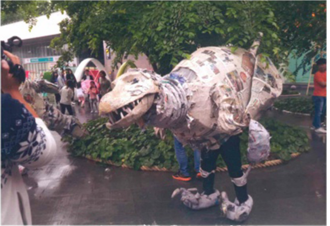
<벨로시랩터의 탄생>을 거리 공연하는 단원의 모습, 나무<극단>제공

□□□□ □□□□ □□□□□□ □□□□ □□□□□ □□□□ □ □□ □□□□□ □□□□□□?