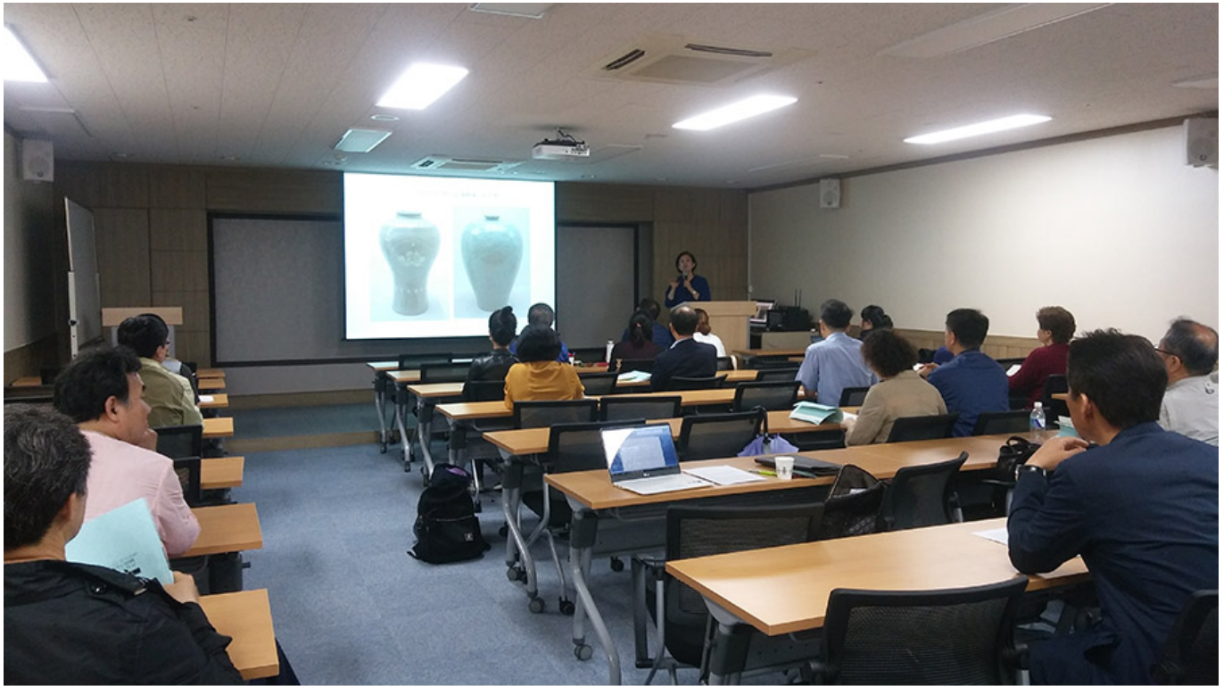
지난 5월 29일 '2018 인천시민대학' 강좌 모습

이 글은 2018년 5월 29일 인천시민대학에서 열린 '2018 인천시민대학' 강좌의 모습입니다. 이날은 1100여명의 시민들이 참여한 가운데, '2018 인천시민대학'의 일환으로 '2018 인천시민대학' 강좌가 진행되었습니다. 이날은 1100여명의 시민들이 참여한 가운데, '2018 인천시민대학' 강좌가 진행되었습니다. 이날은 1100여명의 시민들이 참여한 가운데, '2018 인천시민대학' 강좌가 진행되었습니다.