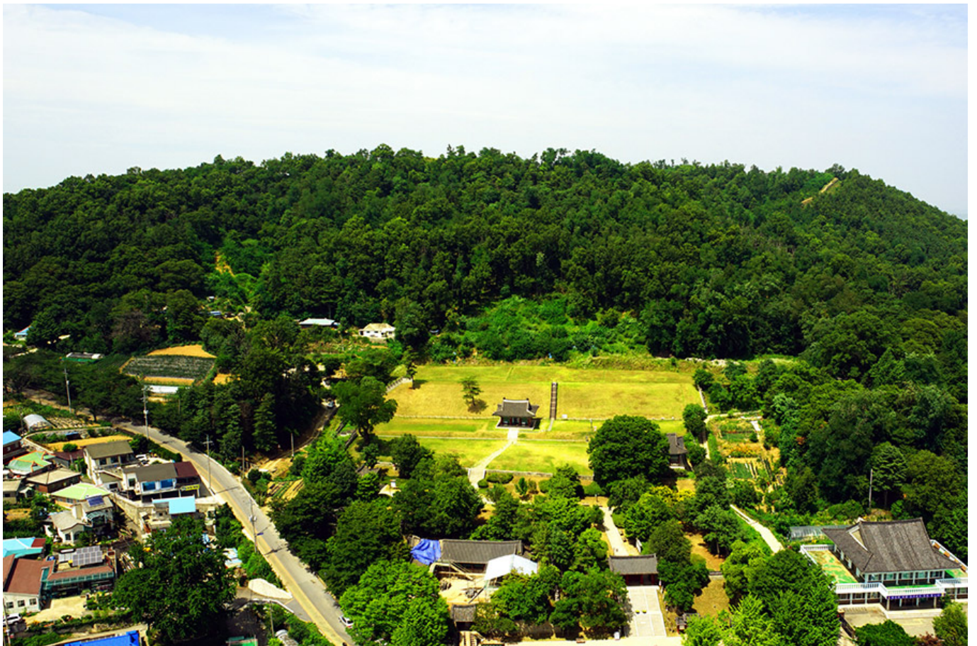
강화 고려궁지, 출처: 강화군 홈페이지

00 00 0000 000 00 0 ‘00’0 00 000 0000 9180 70 2500 0000 13920 0 000 00 0000 0000000 4740 00 000000. 00 0 919000 000 00000 000 00000 0000 0000, 0 000 00 000000 00000 0000 0000. 00 0000 00 190(12320)0 0000 0000 0000 00 0000 0000 0000 00 ‘00’0 00 00000 0000. 00 0000 0000 0 0 000000 00 00 110(12700) 00000 0000 0000 39000 000000. 00 0000 0000 0000 00000 00 0000 00 00 00 0000. 0000 00000 00 00 11000000 00 00 00 ‘20180 0000 00000’0 000000.