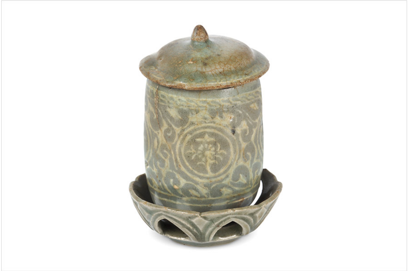
고려 청자, 출처: 강화군 홈페이지

이 청자(靑磁)는 10세기경에 제작된 것으로, 몸통에 문양이 새겨져 있으며, 뚜껑이 달려 있다. 이 청자는 강화군(江華郡)에서 출토된 것으로, 고려(高麗) 초기(初期)의 청자(靑磁)를 대표하는 예(例)이다. 이 청자는 현재 서울(서울)에 있는 국립중앙박물관(國立中央博物館)에 소장(收藏)되어 있다.