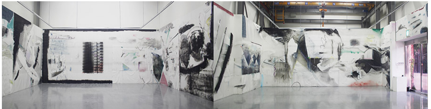
개인전 [GOOD: PAINTING] 전경_페인트 보강비닐 위 혼합재료_인천아트플랫폼 창고갤러리_2017

이재민은 2018년 3월 30일부터 4월 15일까지 10일간 전시되는 5점 12점의 작품이 소개된다. 이재민은 2018년 3월 30일부터 4월 15일까지 10일간 전시되는 5점 12점의 작품이 소개된다.