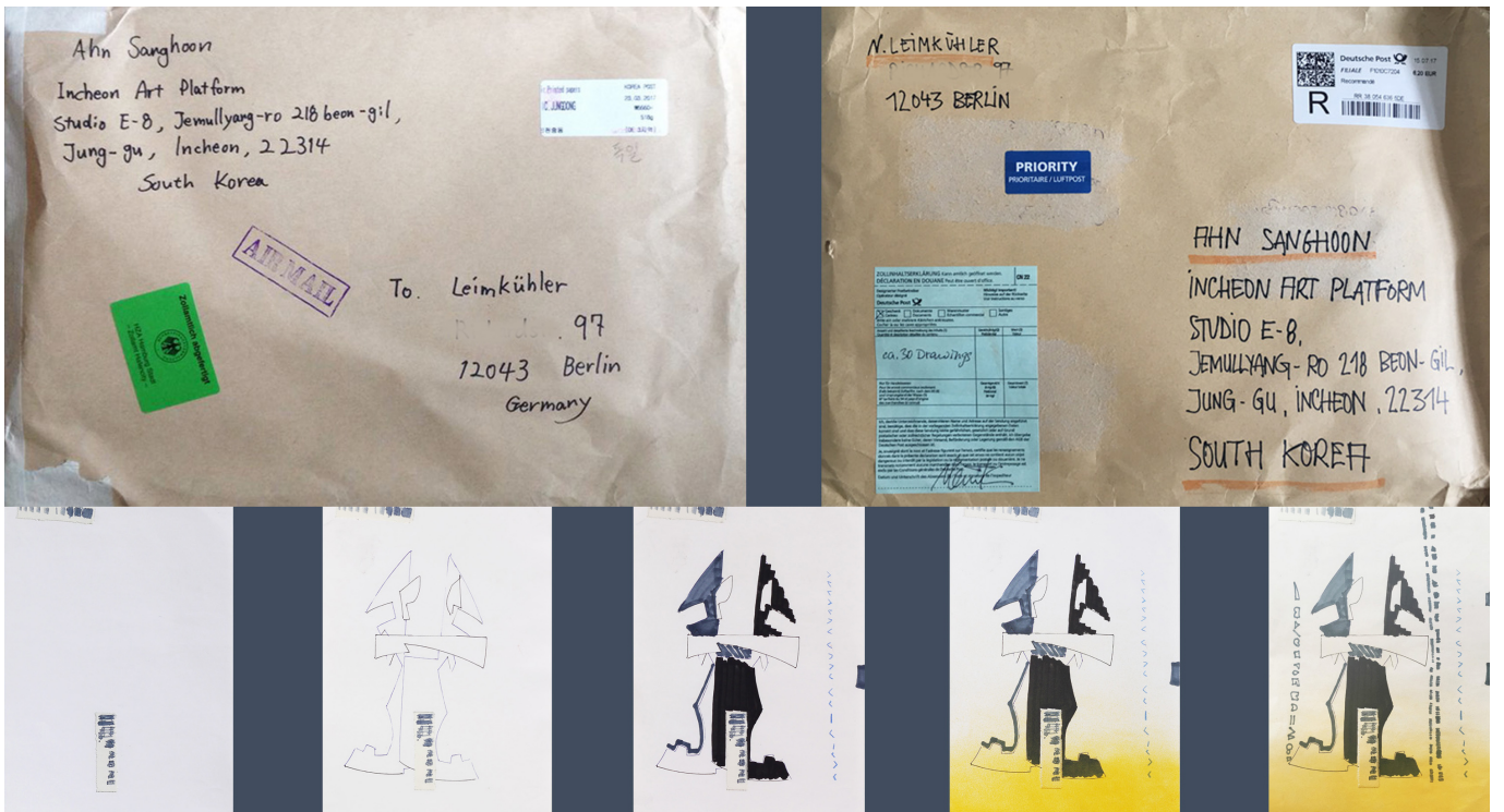
롤링 드로잉_작품, 2017