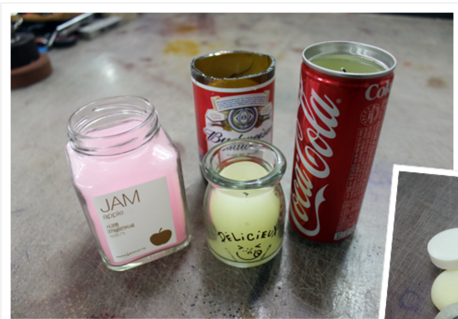
업사이클링한 초와 비누

A. 업사이클링이란 폐기물을 재활용하여 새로운 제품을 만드는 것을 말합니다. 예를 들어, 플라스틱 병을 재활용하여 새로운 용기를 만들거나, 폐지를 재활용하여 종이 제품을 만드는 것입니다. 업사이클링은 환경 보호와 자원 절약에 기여하며, 창의적인 디자인을 통해 새로운 가치를 창출할 수 있습니다. 또한, 업사이클링 제품은 친환경적이고 독특한 디자인을 가진 경우가 많아 소비자들에게 인기가 높습니다.