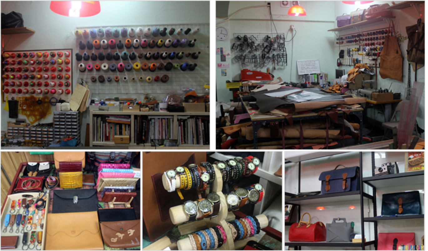
공작소 & 공작소 작품