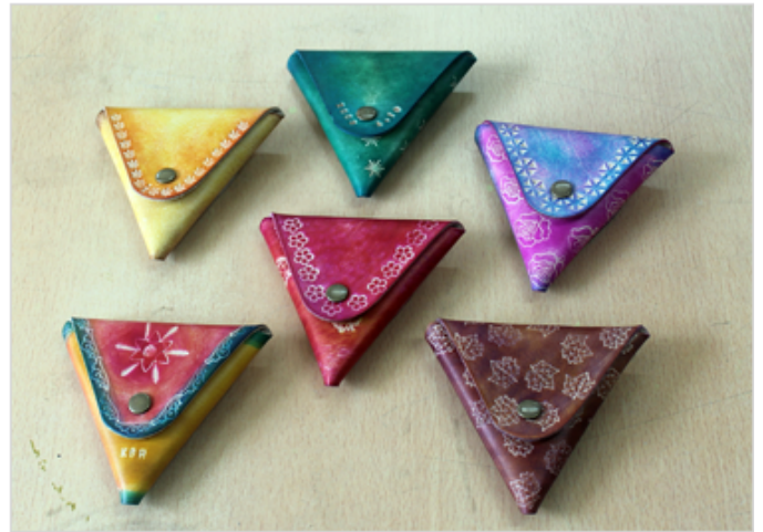
수강생들이 만든 업사이클링 작품