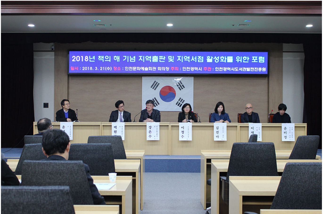
이날 6명의 발제 및 발표자의 발표를 통해 지역서점 활성화 방안에 대한 논의가 이루어졌다.