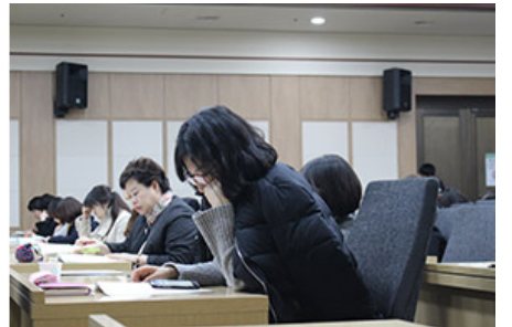
이날 포럼에는 200여 명의 도서관·출판사·지역서점 관계자와 학계 전문가, 시민들이 참석했다.

이날 포럼에는 200여 명의 도서관·출판사·지역서점 관계자와 학계 전문가, 시민들이 참석했다. 이 자리에서는 지역서점의 성공 사례를 공유하고, 지역 주민들에게 사랑받는 서점 운영 방안을 모색하는 시간을 가졌다. 또한, 지역서점의 역할과 중요성에 대해 논의하고, 지역 주민들에게 사랑받는 서점 운영 방안을 모색하는 시간을 가졌다.