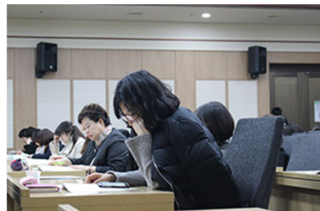
이날 포럼에는 200여 명의 도서관·출판사·지역서점 관계자와 학계 전문가, 시민들이 참석했다.

이날 포럼에는 200여 명의 도서관·출판사·지역서점 관계자와 학계 전문가, 시민들이 참석했다. 이날 포럼에는 200여 명의 도서관·출판사·지역서점 관계자와 학계 전문가, 시민들이 참석했다. 이날 포럼에는 200여 명의 도서관·출판사·지역서점 관계자와 학계 전문가, 시민들이 참석했다. 이날 포럼에는 200여 명의 도서관·출판사·지역서점 관계자와 학계 전문가, 시민들이 참석했다.