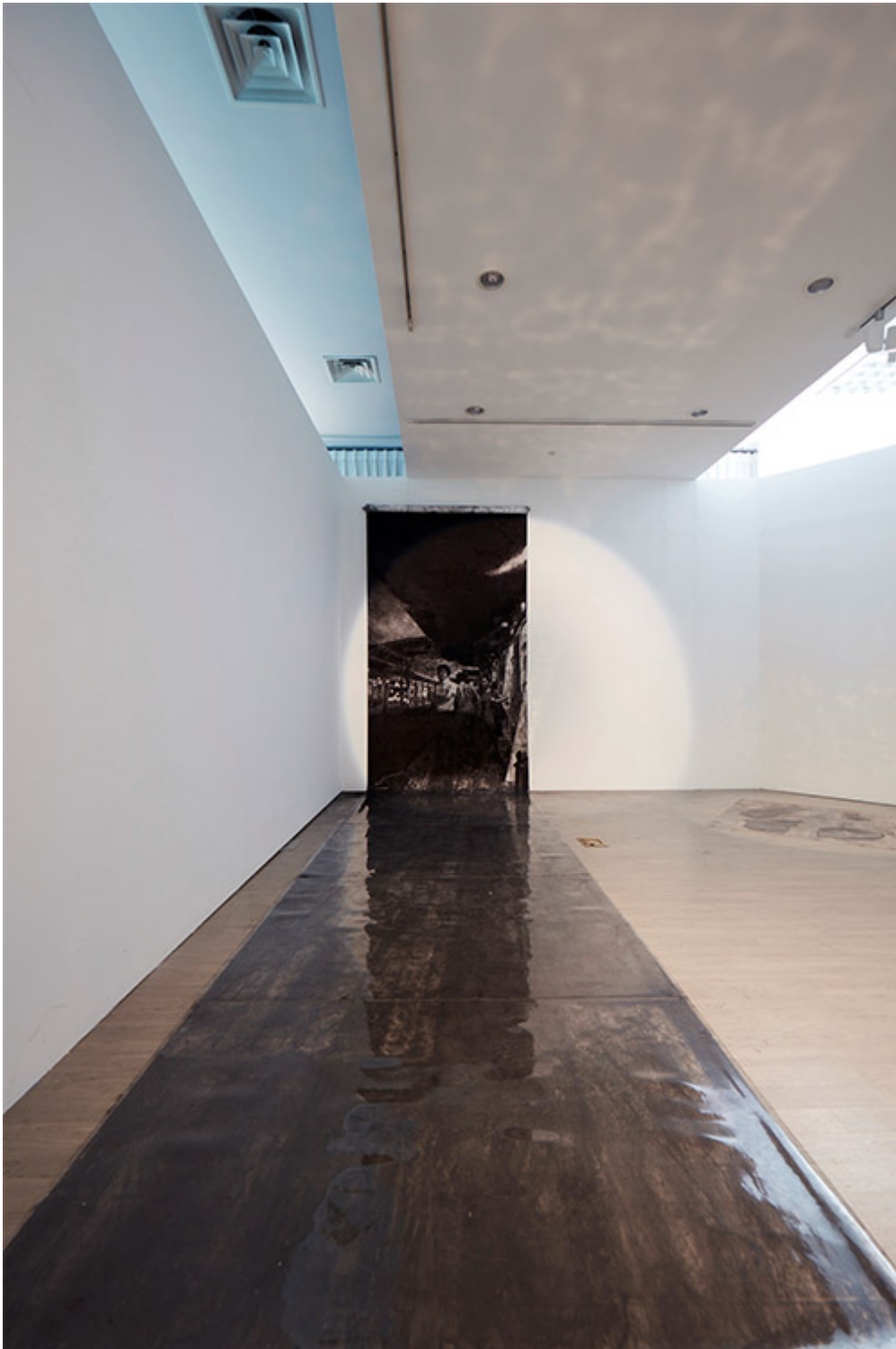
이영우(‘04’년 출생), Drawing(L-Shape), 800×150cm, conte on paper, 2017 Installation view at Gyeonggi Museum of Modern Art

<이영우의 Drawing(L-Shape)>는 관람객의 시선을 끌기 위해 공간의 구조를 따라 L-Shape로 그려진 작품이다. ‘이영우의 공간’은 이영우의 작품이 공간을 어떻게 채우고 있는지를 보여준다. ‘2000년대’는 이영우의 작품이 공간을 어떻게 채우고 있는지를 보여준다. ‘2000년대’는 이영우의 작품이 공간을 어떻게 채우고 있는지를 보여준다.