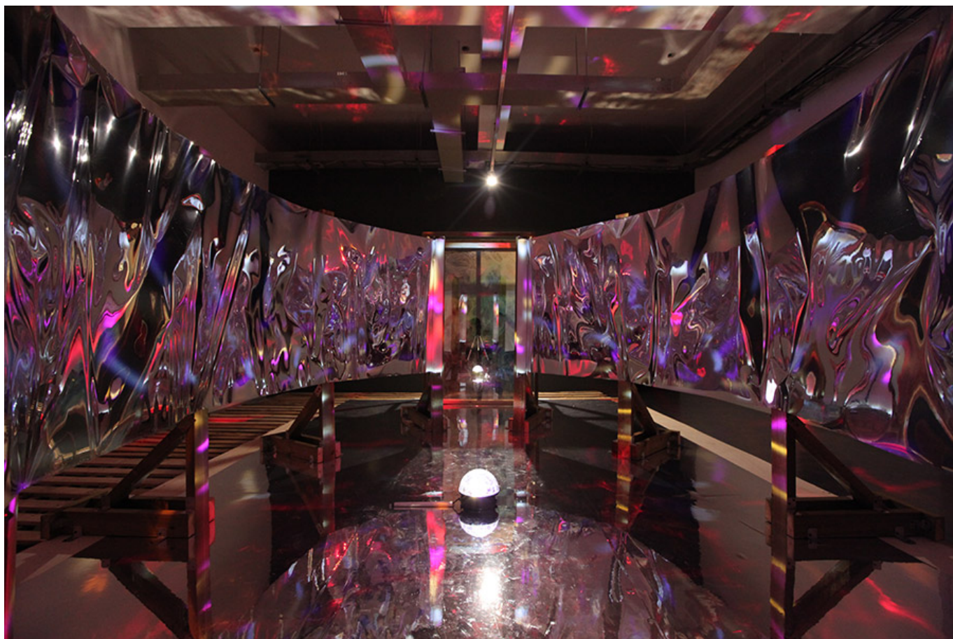
Ark, 330×550×191.5cm, space installation, 2016 Installation view at Gyeonggi Creation Center