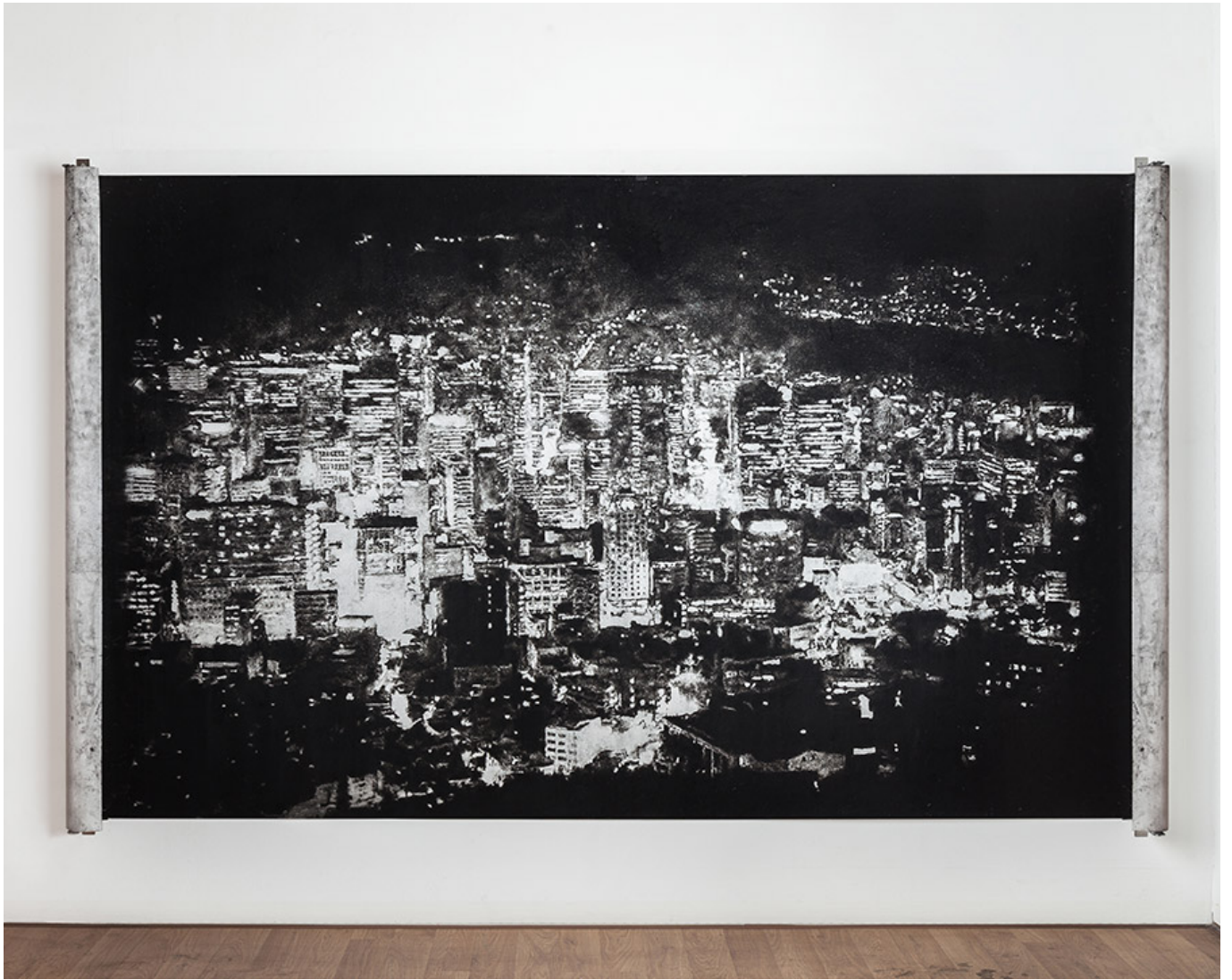
이재현(이재현), Drawing(stroller), 150x240cm, conte on paper, 2017

이재현 <이재현>은 도시의 풍경과 인간의 행동을 주제로 한 다양한 작품을 선보여왔다. <Drawing(stroller)>는 1990년대 후반에 제작된 '이재현(이재현)'의 작품으로, 1990년대 후반에 제작된 '이재현(Flâneur)'의 작품이다. 이 작품은 '21세기 도시'라는 주제로 '이재현(Flâneur)'의 작품으로, 도시의 풍경과 인간의 행동을 주제로 한 다양한 작품을 선보여왔다. 이 작품은 '이재현(conté)'의 작품으로, 도시의 풍경과 인간의 행동을 주제로 한 다양한 작품을 선보여왔다. 이 작품은 '이재현(anonymity)'의 작품으로, 도시의 풍경과 인간의 행동을 주제로 한 다양한 작품을 선보여왔다.