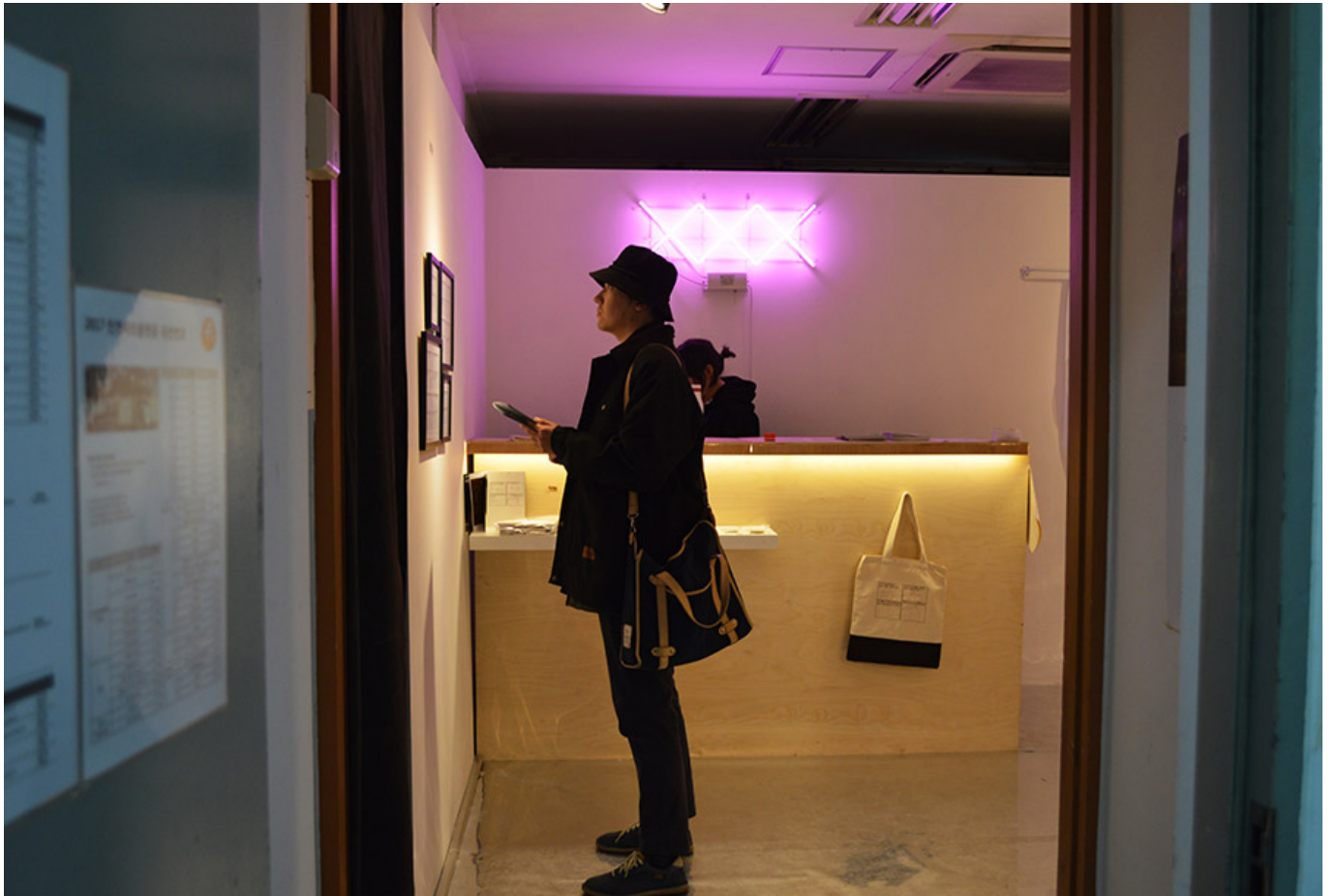
Drawing XXX, Slang Market Project, 2017

이 작품은 6월 1일부터 6월 30일까지 서울의 한 갤러리에서 전시되었습니다. 이 작품은 'Drawing XXX' 시리즈의 일부로, 5월 1일부터 5월 31일까지 전시되었습니다. 이 작품은 '이 작품'이라는 제목으로 전시되었습니다, 이 작품은 이 작품의 일부로 전시되었습니다.