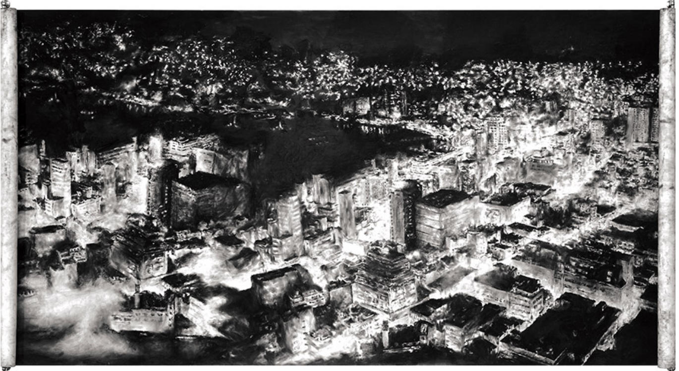
000(00), Drawing(stroller), 150×300cm, conte on paper, 2015