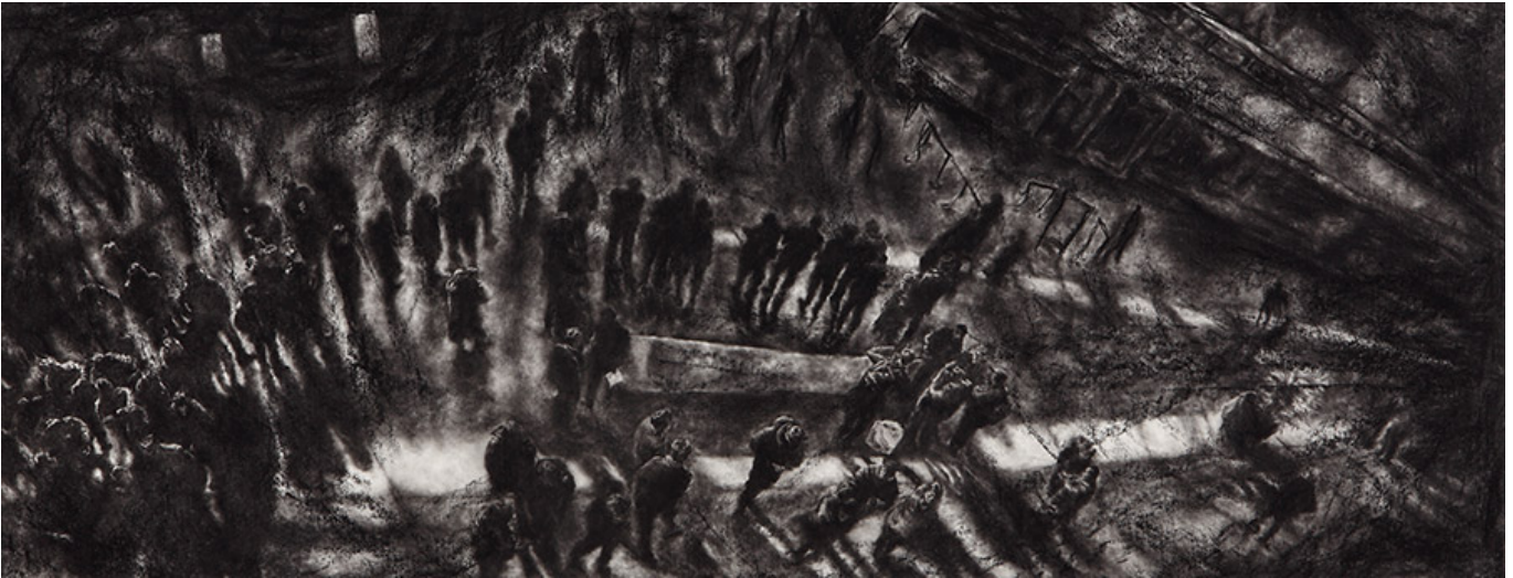
000(00), Drawing(stroller), 40×103cm, conte on paper, 2016

0000 0000 000 00000 0000 000 000 00 000 00 000000 00000 0000 0000000 0000 00. 00 000000 00000 00 00 000 0000 0000 00000 0000 00000 0 <000>, SNS000 0000 00 0000 00000 00000 00 0000 00000000 0000 <0000: 0000>, 0000 00 0000 00000000 0000 00 0000 0000000 00000 <0000 00000>, 0000000 0000 000000 00000 00000 <000> 00 00.