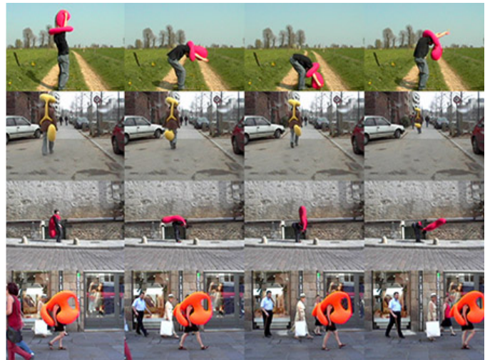
A jaco ?, 7'44, video, color, sound, 4 : 3. 2003