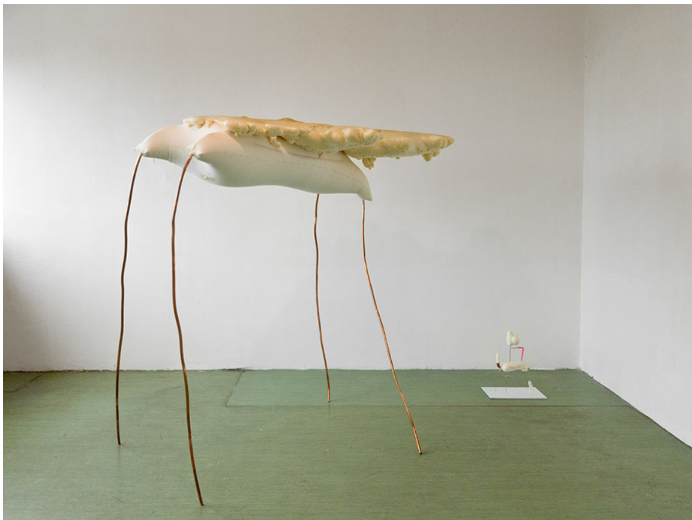
Big Shortened Agility, 170×190×90cm(approx.), fabric, expanding foam, cooper, 2017