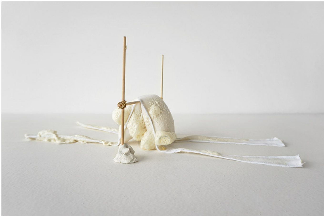
Shortened Agility #4, 30×27×7cm, expanding foam, cooper, paint, wood, hardening modelling clay, 2017