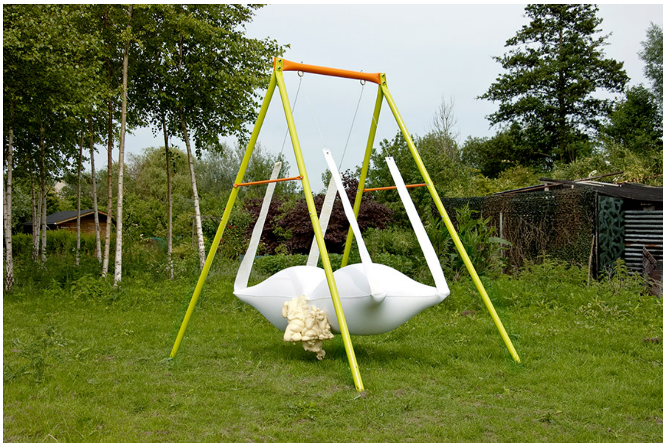
The Duck's Stress, 190×190×135cm, fabric, expanding foam, epoxy resin, eyelets, steel cables, swing, 2016 Exhibition view of Tropical Waterworld, outdoor solo show, Art, Cities and Landscape, the Hortillonnages of Amiens, France – production Maison de la Culture d'Amiens, 2016