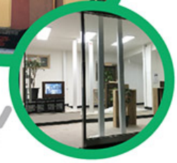
지역성 참여형 예술문화거점