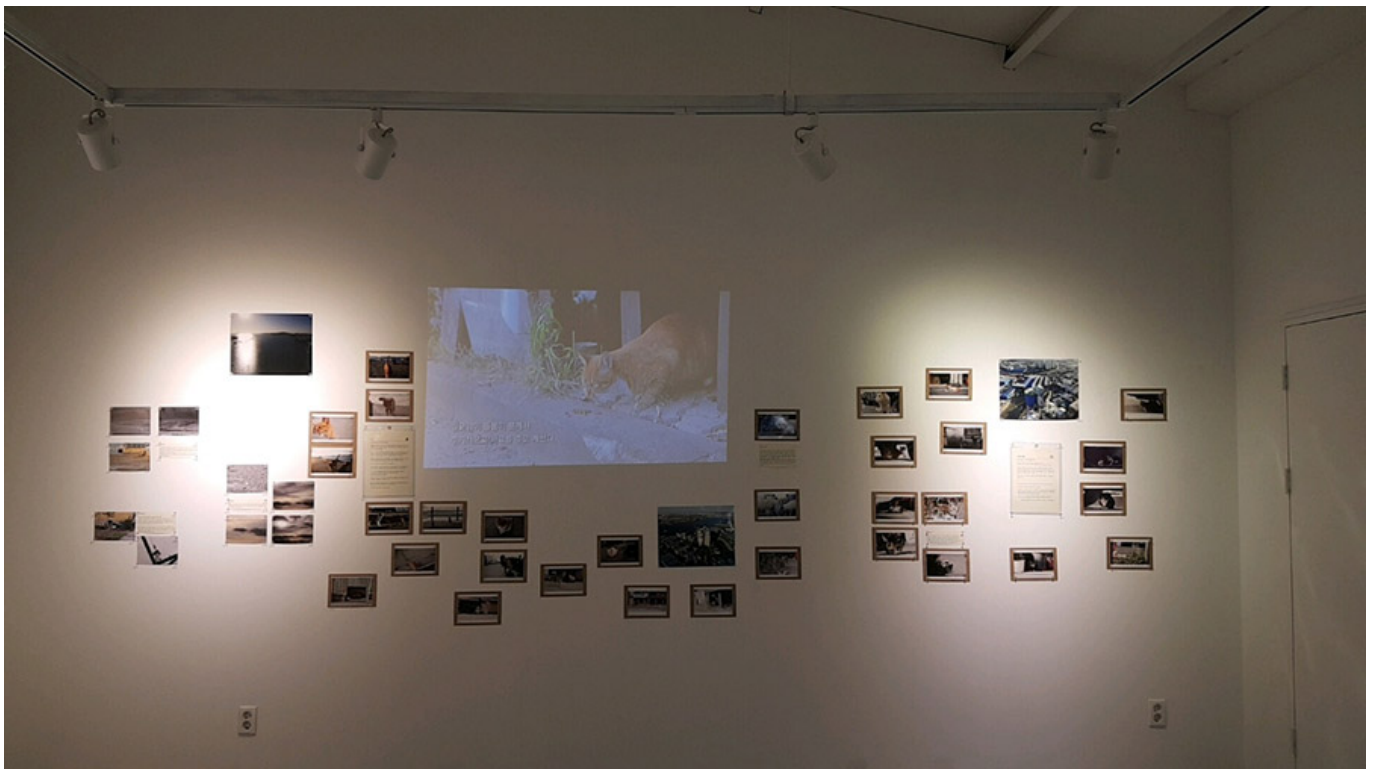
만석동 마을 스케치 영상

이 사진은 만석동 우리미술관 입구 골목길의 모습을 담고 있다. 사진 속에는 한 마리의 개가 골목길의 중앙에 서 있으며, 오른쪽에는 나무 문과 쓰레기통이 보인다. 이 사진은 만석동 마을의 전통적인 분위기를 잘 보여준다.