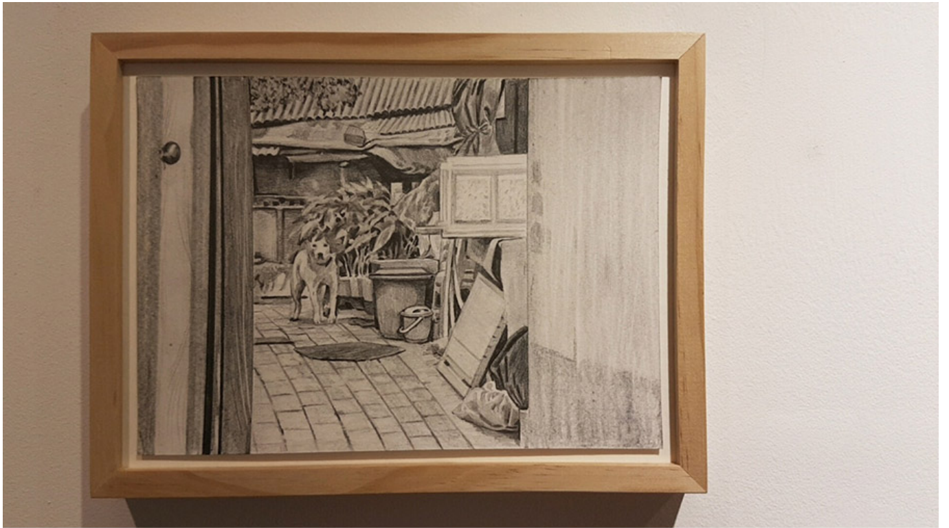
만석동 우리미술관 입구 골목길

이 사진은 만석동 우리미술관 입구 골목길의 모습을 담고 있다. 사진 속에는 한 마리의 개가 골목길의 중앙에 서 있으며, 오른쪽에는 나무 문과 쓰레기통이 보인다. 이 사진은 만석동 마을의 전통적인 분위기를 잘 보여준다.