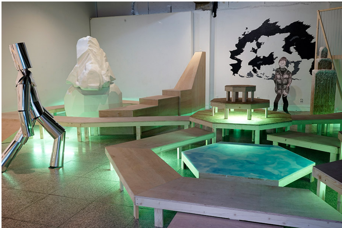
2016년 11월, 서울 국립현대미술관, 2017