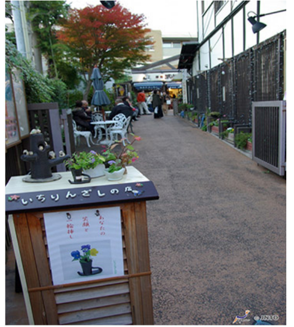
도쿄의 나카메구로(좌)와 가나가와의 가마쿠라(우)의 골목길.

관광객은 도시의 다양한 골목길을 탐험하고, 전통적인 분위기를 느끼고, 독특한 가게와 카페를 발견할 수 있다. 이러한 경험은 도시의 숨겨진 아름다움을 보여준다.